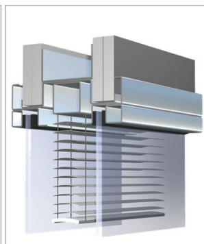
Doppelverglasung mit Jalousie